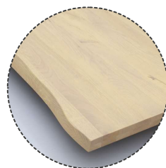
BAUMKANTE nicht möglich bei Rund, Oval und Dänisch Oval