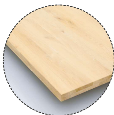
GERADE TISCHKANTE nicht möglich bei Dänisch Oval