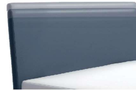
0300 Multimaß Höhe 55 - 125 cm in 5cm-Schritten kürzbar gegen Aufpreis