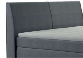
0023 Höhe 106 cm gegen Aufpreis