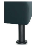
M24-10 M24-15 Metallfuß schwarz gegen Aufpreis