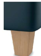
H17-10 H17-15 Holzfuß Buche natur lackiert gegen Aufpreis