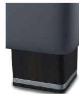
H 05-10 H 05-15 Holzfuß wengefarbig gegen Aufpreis