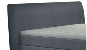
0689 Höhe 119 cm gegen Aufpreis