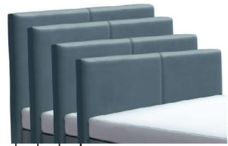
→ 0846S - Höhe 99 cm → 0846M - Höhe 109 cm* → 0846L - Höhe 119 cm → 0846XL - Höhe 129 cm * Standard