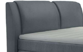
0327 Höhe 108 cm gegen Aufpreis