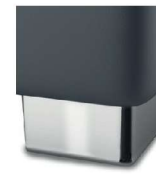
M 09-10 M 09-15 Metallfuß verchromt gegen Aufpreis