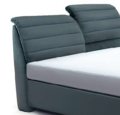
0850KV Höhe 112-123 cm nur lieferbar bei Bettgrößen 160-200cm Breite gegen Aufpreis