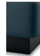
S08-10 S08-15 Bettsockel schwarz gegen Aufpreis