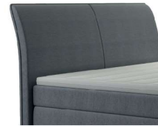
0022 Höhe 106 cm gegen Aufpreis