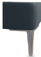
A11-10/M12 A11-15/M12 Alufuß gebürstet gegen Aufpreis