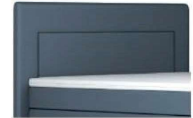
0025 Höhe 122 cm gegen Aufpreis