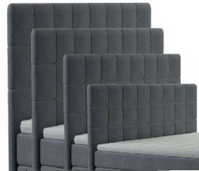
→ 0046S - Höhe 99 cm → 0046M - Höhe 109 cm → 0046L - Höhe 119 cm → 0046XL - Höhe 129 cm gegen Aufpreis