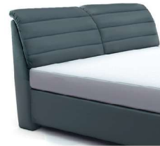
0850 Höhe 112 cm nur lieferbar bei Bettgrößen 160-200cm Breite gegen Aufpreis