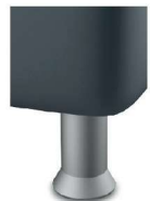
K01-10 K01-15 Kunststofffuß alufarbig Standard