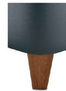
H25-10 H25-15 Holzfuß Eiche natur geölt gegen Aufpreis