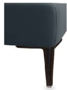
A11-10/M01 A11-15/M01 Alufuß schwarz matt gegen Aufpreis