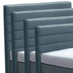
→ 0849S - Höhe 99 cm → 0849M - Höhe 109 cm → 0849L - Höhe 119 cm → 0849XL - Höhe 129 cm gegen Aufpreis